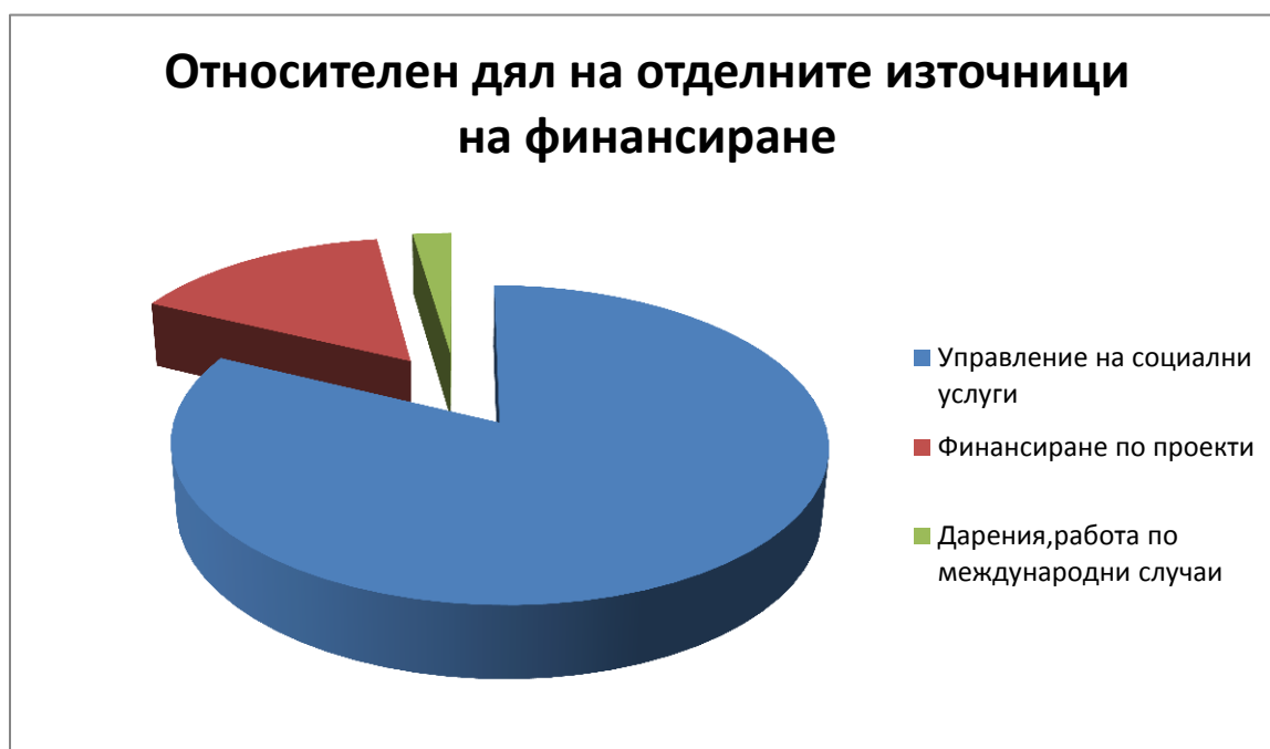
Фигура 1. Източници на финансиране през 2014 г.

През 2014 г. за всички дейности, изпълнявани от МСС-България, сме получили финансиране в размер на 1 488 043, 93лв. Основен дял заемат държавно-делегираните дейности – 1 228 289,20 лв. (82,5%), чрез управлението на социални услуги. Следва финансирането по проекти за постигане на конкретни цели – 225 954, 30 (15,2%). Получените през годината дарения (22 811,65 лв.), приходите от работа по международни случаи (6 116, 44 лв.) и по фактури за обучения и супервизии, предоставени от фондацията (4872,34 лв.) съставляват 2,3% (фигура 1)